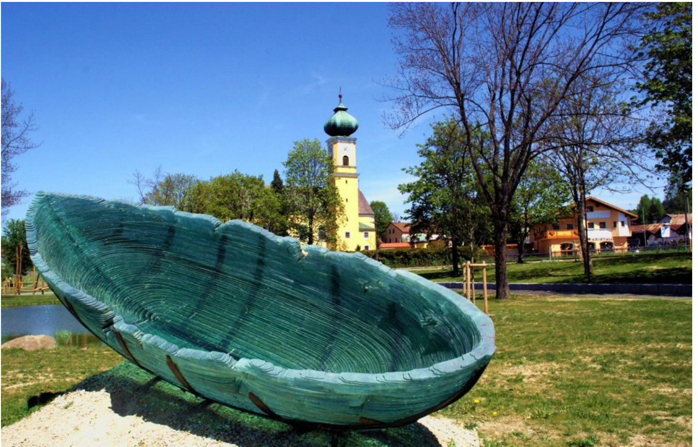
An der Glasstraße genießt man Glaskunst und Natur im Einklang. www.die-glasstrasse.de (c) Stefan Moder