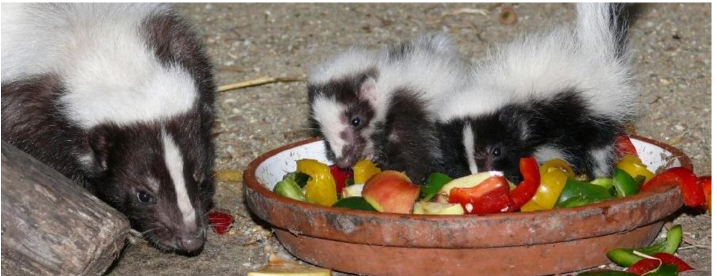
Hoch über dem Markt Ortenburg und direkt neben dem Renaissance-Schloss gelegen, war der heutige Wildpark Schloss Ortenburg im 16. und 17. Jahrhundert die französische Gartenanlage und das Tiergehege der Grafen von Ortenburg. www.wildpark-ortenburg.de (c) Wildpark Ortenburg