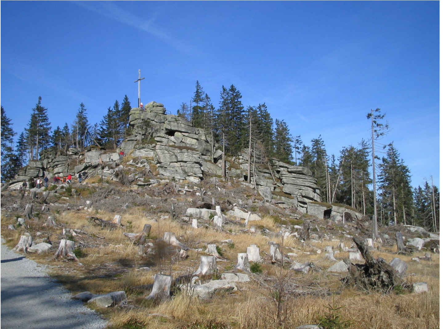
An der höchsten Stelle des Dreisesselbergs, Hochstein genannt, befindet sich ein markanter Granitfels mit Gipfelkreuz, von dem man eine gute Aussicht hat. www.dreisessel.com