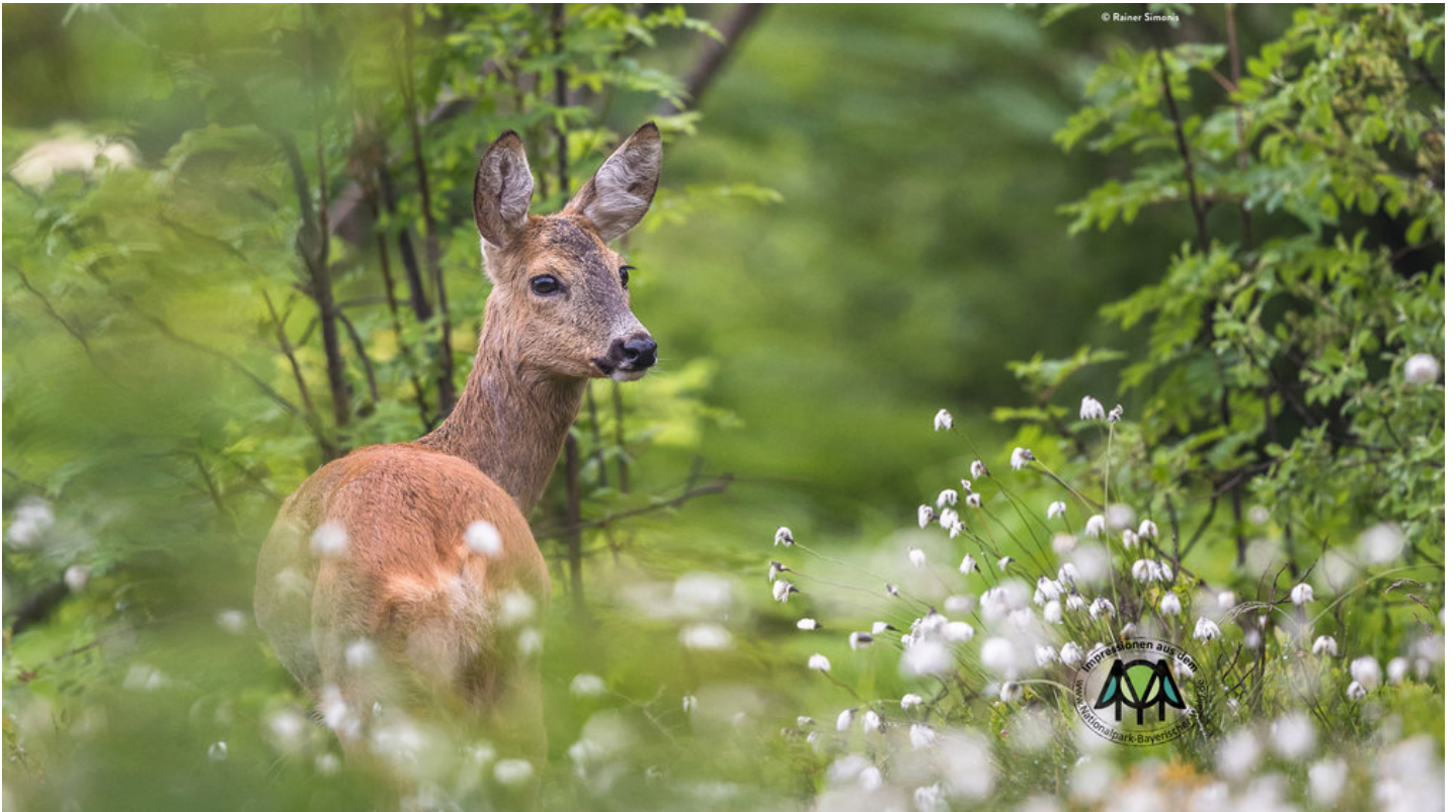
Der Nationalpark Bayerischer Wald direkt an der Grenze zu Tschechien wurde am 07.10.1970 als erster Nationalpark Deutschlands gegründet. www.nationalpark-bayerischer-wald.de