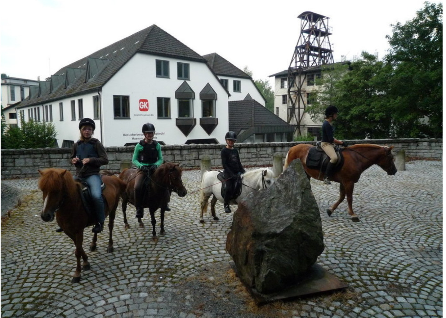
Hier im einzigen Graphitbergwerk Deutschlands in Kropfmühl entdecken Sie die Welt der Bergleute. Unsere Ponys machen Pause vor dem Museum. www.graphit-bbw.de