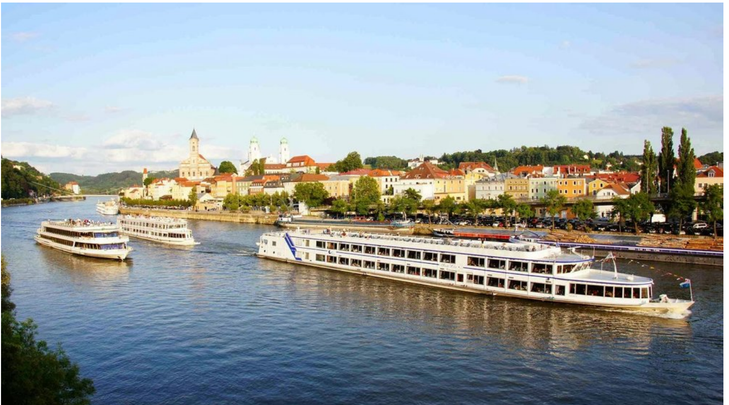
Eine Dreiflüsse-Stadtrundfahrt mit dem Schiff gehört zu den Höhepunkten jeder Passau-Tour.