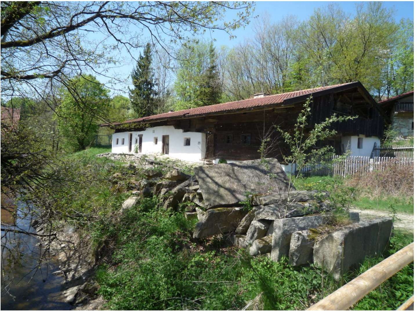
Das Museumsdorf Bayerischer Wald ist ein Freilichtmuseum bei Tittling am Südwestufer des Dreiburgensees im Bayerischen Wald. www.museumsdorf.com