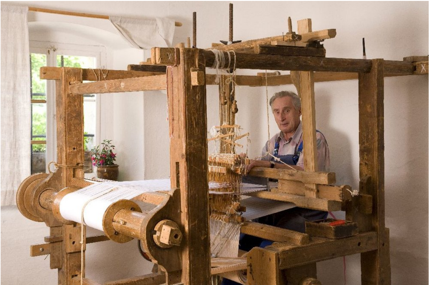
Um dieses für den Unteren Bayerischen Wald so wichtige Gewerbe vor dem Vergessenwerden zu bewahren, wurde 1983 beim Freizeitzentrum Gegenbach in einem alten bäuerlichen Anwesen das Breitenberger Webereimuseum eingerichtet