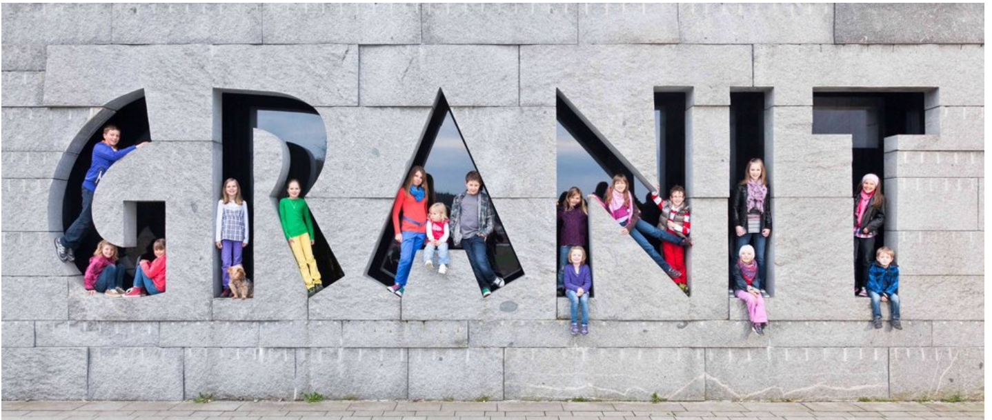
Das Granitzentrum in Hauzenberg im Bayerischen Wald. Der Steinbruchsee im Granitzentrum setzt Wissenswertes zum Granit gekonnt in Szene.